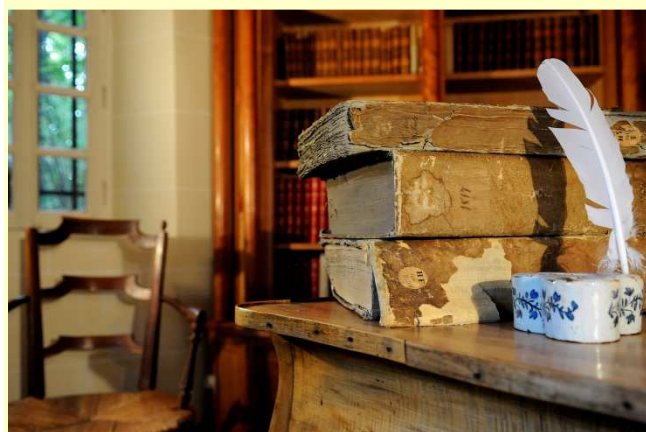
Le bureau de Chateaubriand dans la tour Velléda

Céleste de Chateaubriand cahier rouge in Mémoires de Madame de Chateaubriand, Cahier rouge et cahier vert , collection l'histoire en mémoire, Perrin 1990, pages 69-70.