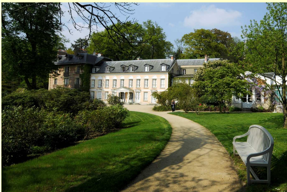
La maison de Chateaubriand