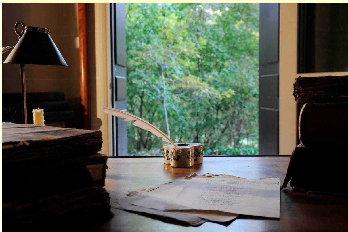
Le bureau de Chateaubriand dans la tour Velléda

Destinée de l'homme ! Si René n'eût point rencontré cette femme, il se fût éloigné de plus en plus du lieu fatal. L'Indienne lui montra sa route et le quitta après lui avoir recommandé l'enfant qu'elle avait perdu. Il se leva enfin, le jour qui devait être suivi d'une nuit si funeste ». Chateaubriand, Les Natchez .