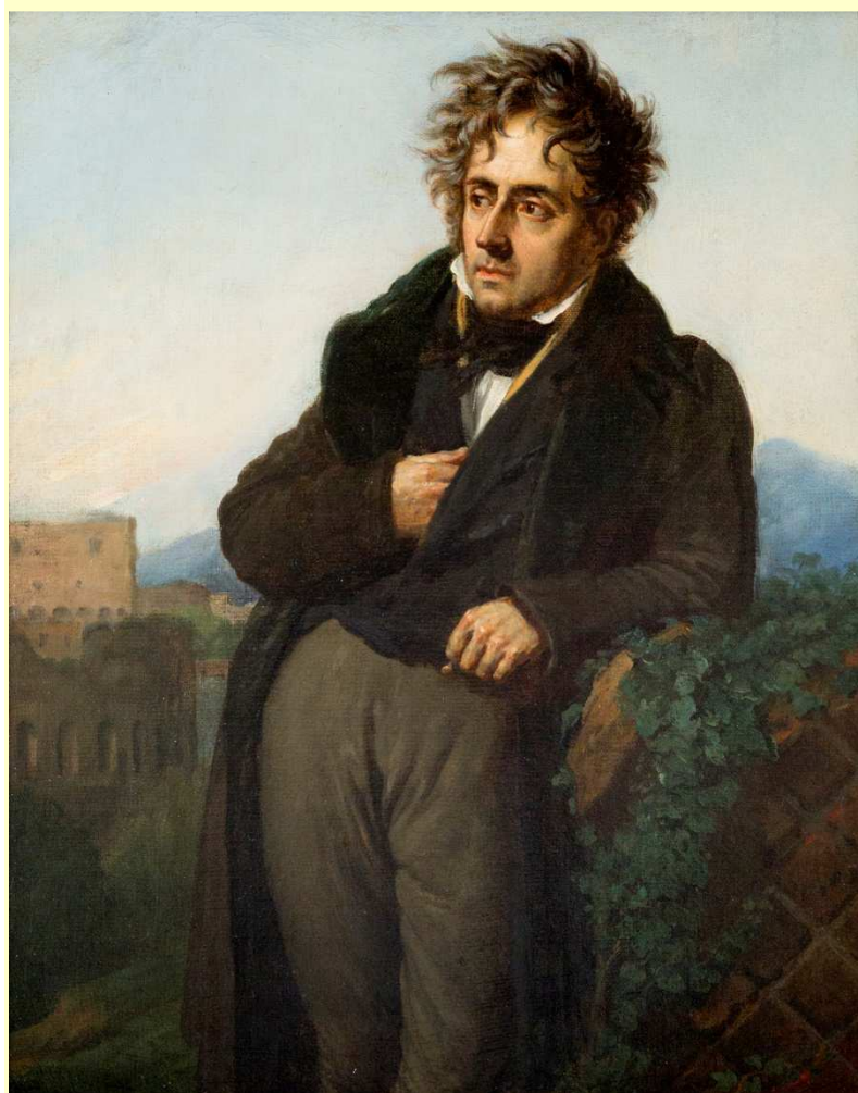
Modello du portrait de Chateaubriand par Girodet

Né en 1768, mort en 1848, Chateaubriand a été le témoin d'événements qui ont bouleversé l'histoire de la France. Il a été témoin du règne de Louis XVI, de la Révolution, du Directoire, de l'Empire, de la Restauration de la monarchie, de la Révolution de 1830, du règne de Louis-Philippe, et de la Révolution de février 1848 qui a consacré l'avènement de la Seconde République. Il décède le 4 juillet 1848 pendant les événements qui conduiront au coup d'état du futur Napoléon III.