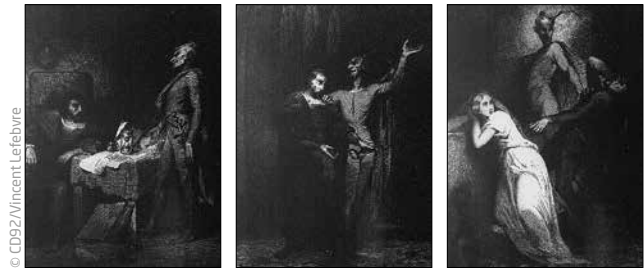
Illustrations par Tony Johannot du Faust de Goethe

d'Alexandre Sokourov (2011), Lion d'or de la Mostra de Venise en 2012. VOST - en partenariat avec le Cinéma Le Rex